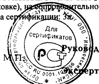
Схема сертификации: 3ж

ДОПОЛНИТЕЛЬНАЯ ИНФОРМАЦИЯ Место нанесения знака соответствия: на изделии, на таре (упаковке), на сопроводительной технической документации.